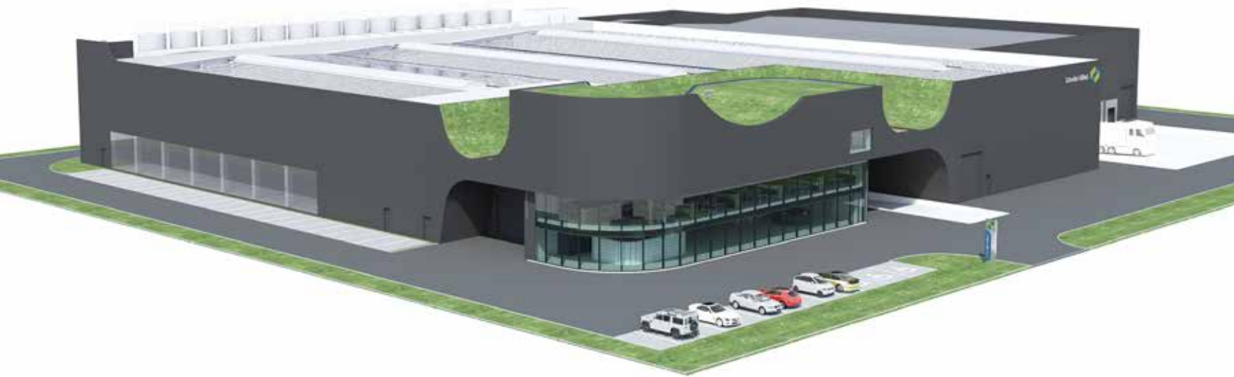
Blue Oceans XL investeert 8 miljoen euro voor Schoeller Allibert in de nieuwe Limburgse vestiging te Paal - Beringen.

Tekst | Hilde Neven