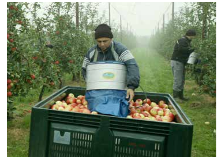
Deze Big Box is o.a. bestemd voor gebruik in de fruitteelt en wordt een van de eerste producten van de nieuwe fabriek in Beringen.

Met mijn achtergrond in polymeren leek me dat wel een goed plan. Zo'n acht maanden later, op tweede kerstdag als ik me niet vergis, heb ik mijn vennootschap BiPP, het huidige Schoeller Allibert Bel-