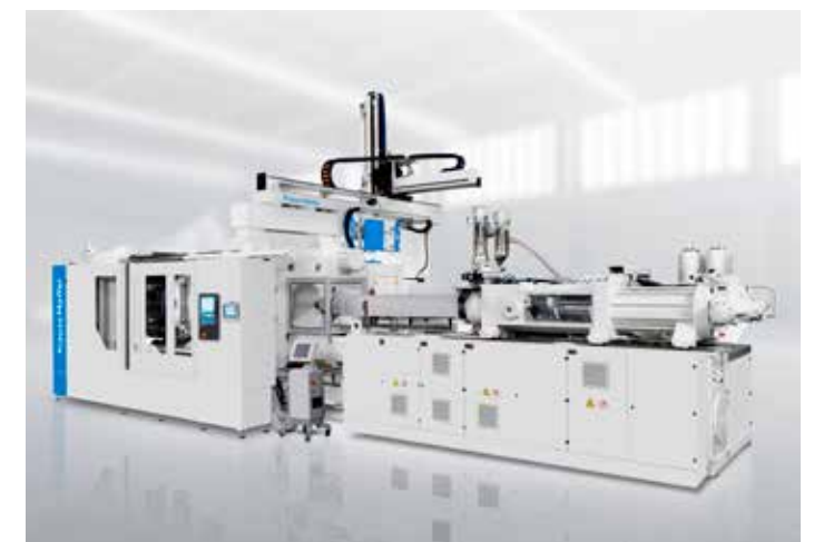
In de nieuwe productiehal komt er een 4.000 ton sluitkracht injection moulding machine, waarschijnlijk een van de grootste machines die ooit in Benelux geplaatst is.