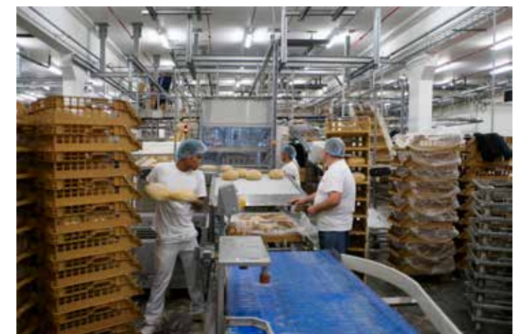
Stack Nest brood container voor retail.